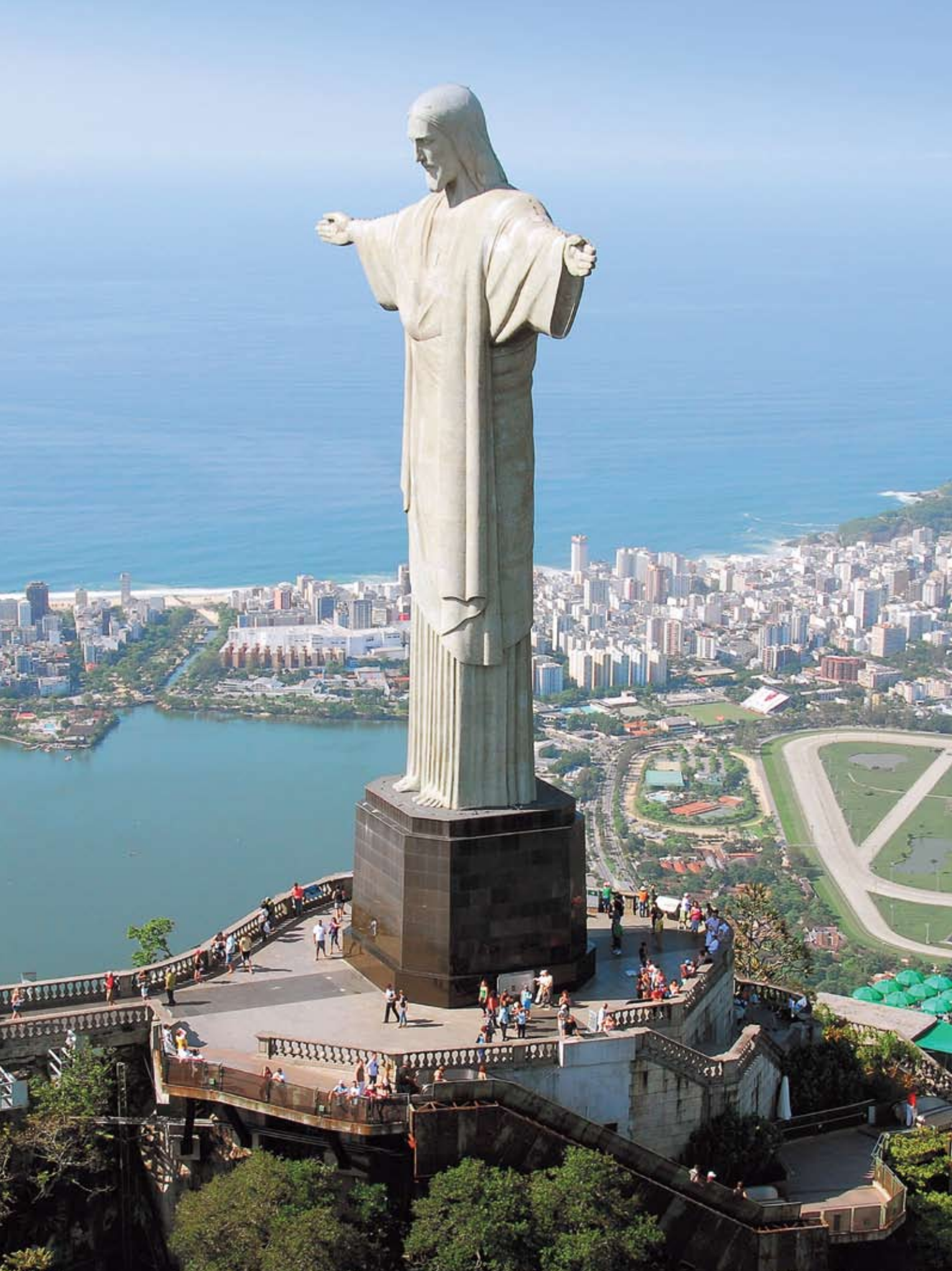
Vista aérea do Cristo Redentor.