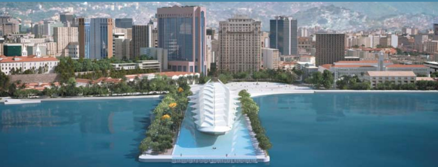
Maquete do Museu do Amanhã, investimento que faz parte do projeto de revitalização da Zona Portuária do Rio de Janeiro.